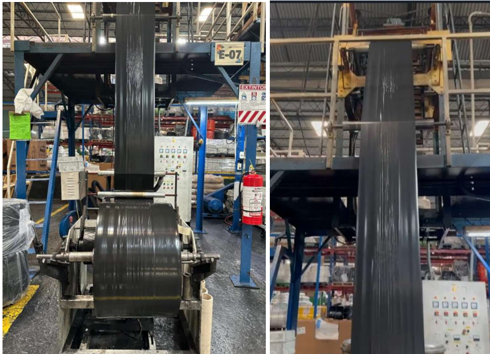
Lámina o película que se enrolla en grandes bobinas