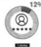
Anexo N° 2 25 firmas 'fintech' crecen aquí sin un ecosistema para su desarrollo