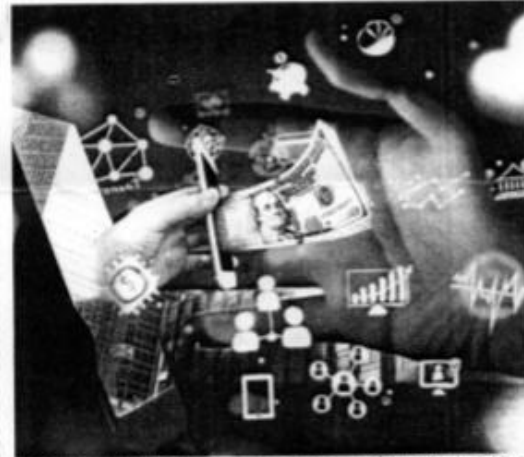
Según el BID, una de las mayores limitaciones al desarrollo de emprendimientos 'fintech' es la falta de recursos financieros, pese al financiamiento que muchos requieren".

» Empresas ofrecen servicios financieros con tecnologías innovadoras