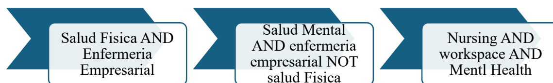
Cuadro N. 5 Flujograma de búsqueda

relaciones establecidas entre componentes se visualizan con los operadores booleanos. El uso de filtros de búsqueda entre ellos el año ya que el periodo se debía establecer del 2019 – 2024 y los idiomas para encontrar la información: inglés, español y portugués con la finalidad de poder obtener información más amplia sin limitarse a un solo idioma.