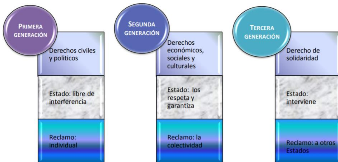
Figura 1. Clasificación de los Derechos Humanos

A continuación, se enmarcan la clasificación de los Derechos Humanos.