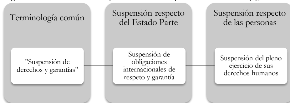
Figura No. 1: Precisión conceptual sobre la “suspensión de derechos y garantías”.

Por tales motivos, cuando se aluda a la “suspensión de derechos y garantías”, el término debe precisarse en la suspensión de obligaciones internacionales (respecto del Estado Parte) y, a su vez, del pleno ejercicio de los derechos humanos (respecto de las personas); lo cual, para efectos didácticos, se resume en la Figura No. 1: