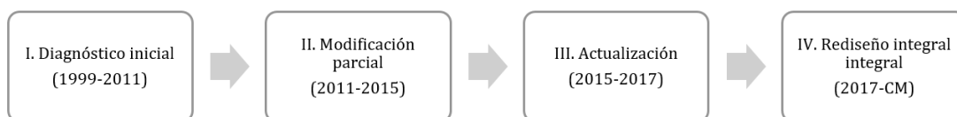
Figura 2. Metodología rediseño curricular

También se apoya en los métodos Histórico Lógico, Análisis Síntesis e Inducción Deducción en la búsqueda y presentación de los elementos que permitieron llegar a la propuesta del plan de estudios rediseñado. El método de Abstracción Concreción se utilizó para la concepción de las propuestas de mallas curriculares en aras de combinar la teoría con la práctica. Es por eso que esta investigación se clasifica también como descriptiva explicativa. La metodología de trabajo para la implementación se rige por las etapas que se presentan en la Figura 2.